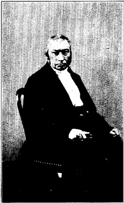
ADRIAAN VAN VOLLENHOVEN 1801—1871