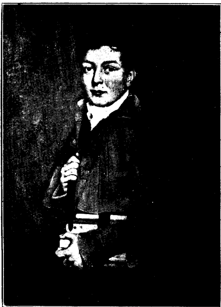
ANTONIE VAN VOLLENHOVEN 1819—1843