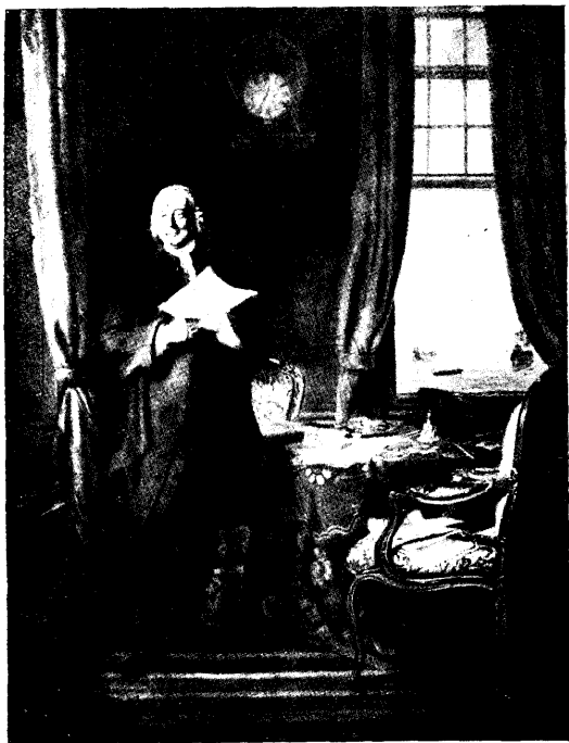
JOHAN VAN VOLLENHOVEN 1703—1784